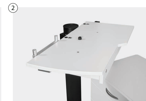
2 Manueller Schwenktisch mit einer oder zwei Positionen mit Magnetbremse Manual swivel table with one or two positions with magnetic brake