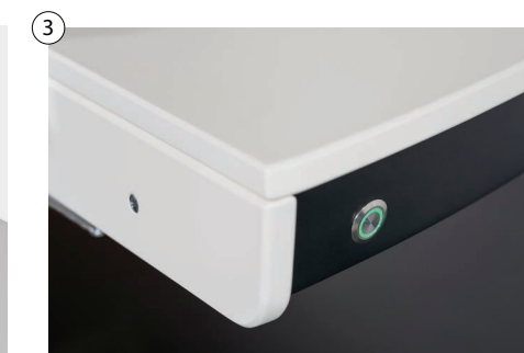
3 Stufenlose magnetische Fixiereinrichtung Stepless magnetic fixing device