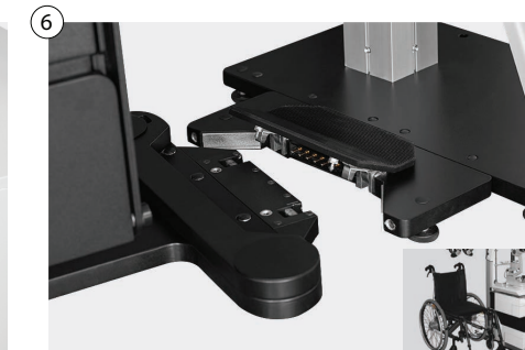
6 Kabellose mechanische Stuhlverschiebung in jede Richtung - Spezialeinklinksystem Wireless mechanical chair movement easily rollable in any direction - special latching system