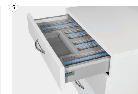
5 Container mit 3 Schubladen (Softeinzug) für Zubehör Container with 3 drawers (soft close) for accessories