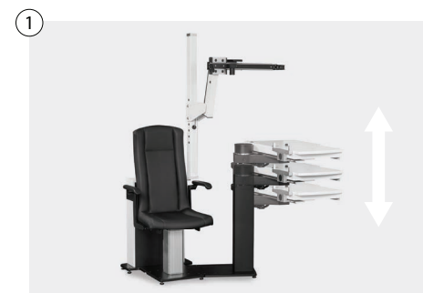
1 Einheit elektromotorisch stufenlos höhenverstellbar (ca. 73-103 cm) Unit electromotive infinitely height-adjustable (approx. 73-103 cm)