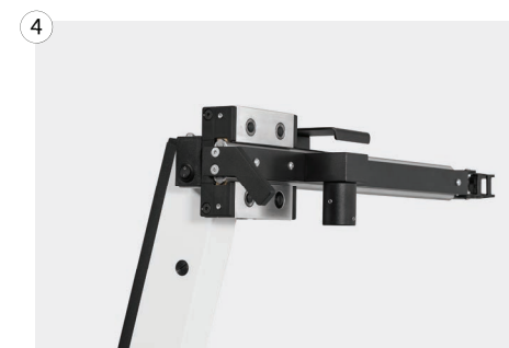
4 Physiologischer Phoropterarm vorgeneigt oder mit stufenloser Neigevorrichtung Physiological phoropter arm pre-tilted or with stepless tilting device