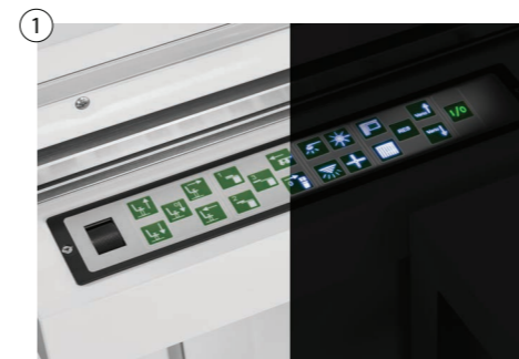
① Antibakterielle Folientastatur mit oder ohne Beleuchtung Antibacterial foil keyboard with or without illumination