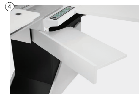
④ Schwenkbare Schublade für Messgläser und Zubehör Drawer for trial lenses or accessories