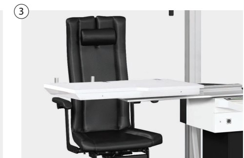
③ Teleskopisch mit einer oder zwei Positionen manuell oder elektromotorisch Telescopic table with one or two positions, manually or electromotive