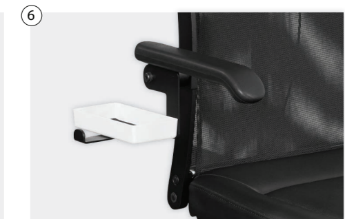
⑥ Stuhl: Carat®, Neo®, Vito® oder Zac® mit oder ohne Bri-Ta® Taschen- und Brillenablage Chair: Carat®, Neo®, Vito® oder Zac® with or without Bri-Ta® pocket and spectacle system