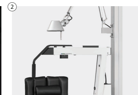
② Physiologischer Phoropterarm vorgeneigt oder mit stufenloser Neigevorrichtung Physiological phoropter arm pre-tilted or with stepless tilting device