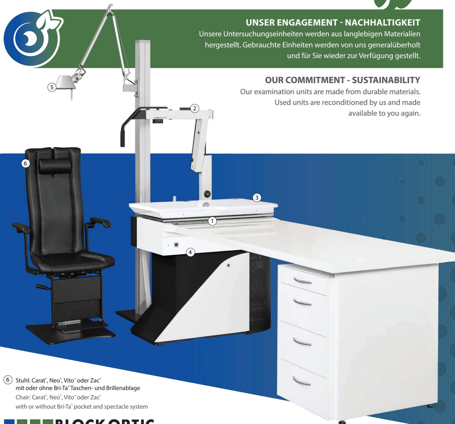
⑥ Stuhl: Carat®, Neo®, Vito® oder Zac® mit oder ohne Bri-Ta® Taschen- und Brillenablage Chair: Carat®, Neo®, Vito® oder Zac® with or without Bri-Ta® pocket and spectacle system

Our examination units are made from durable materials. Used units are reconditioned by us and made available to you again.