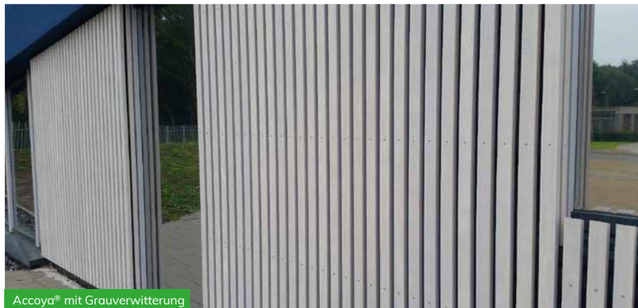
Accoya® mit Grauverwitterung

Eine weitere Maßnahme, um das Risiko von Schimmel/Hefewachstum auf und durch die Beschichtungen zu verringern, ist die Verwendung einer dickeren Schicht, da diese die Feuchtigkeitsabsorption verringert. Diese filmbildenden Beschichtungen sind typischerweise für Verkleidungen geeignet.