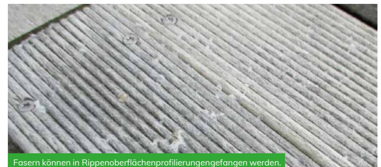
Fasern können in Rippenoberflächenprofilierungengefangen werden.

In all diesen Fällen ist die Haltbarkeit des Accoya® Holzes in keiner Weise beeinträchtigt. Jedoch empfiehlt es sich, regelmäßig alle losen Fasern zu entfernen, da diese sich an einem Ort sammeln, wo sich dann Organismen niederlassen, was zur Verunstaltung des Holzes führen kann.