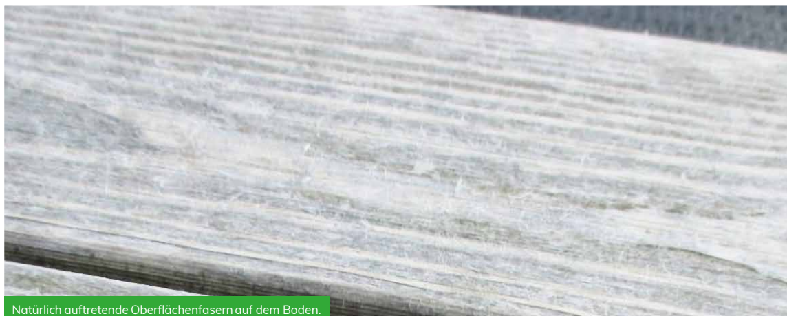
Natürlich auftretende Oberflächenfasern auf dem Boden.

Je höher die Menge oder die Intensität der UV-Oberfläche ist, desto schneller entwickelt sich dieser Prozess. Es ist anzumerken, dass diese Fasern auf allen exponierten Holzarten, einschließlich Accoya®, insbesondere auf flachen Oberflächen, wie Böden gebildet werden. Ein geripptes Bodenprofil neigt dazu, diese Fasern anzusammeln, was es umso auffälliger macht.