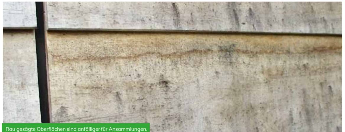
Rau gesägte Oberflächen sind anfälliger für Ansammlungen.

Während diese Oberflächenwucherungen nicht selbst zum Verfall führen, sind sie oft mit dem Beginn des Pilzverfalls von Holz verbunden. Auf der ungiftigen Oberfläche von Accoya® kann Schimmel wachsen, aber die Fäule, die die Unversehrtheit des Accoya® beeinflussen könnte, beginnt damit nicht.