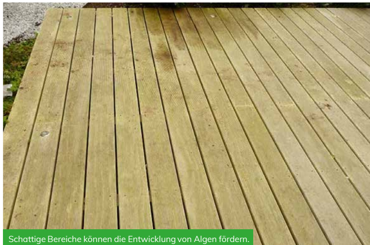
Schattige Bereiche können die Entwicklung von Algen fördern.

Dies wird nicht nur auf der Oberfläche beim Trocknen sichtbar, sondern hat auch einen Einfluss auf die Entwicklung von Schimmelpilzen, Algen und so weiter.